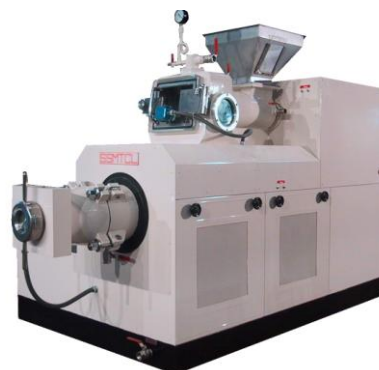
Boudineuse duplex sous vide

La fabrication de savon de ménage est différente de celle des savons de toilette expliquée par ailleurs ( cf. ligne de finition version automatique ou semi-automatique ). La ligne de finition est automatique mais les machines utilisées sont d'une plus grande capacité vu que le savon de ménage est par définition plus grand que le savon de toilette et que la quantité produite doit être importante.